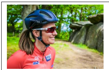
Site de la Roche-aux-Fées ESSE ©#àlaligne

Aujourd'hui, triathlète, elle a participé au Ironman de Nice en 2019.