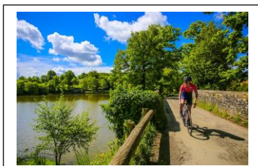
Etang de Chevré La Bouëxière