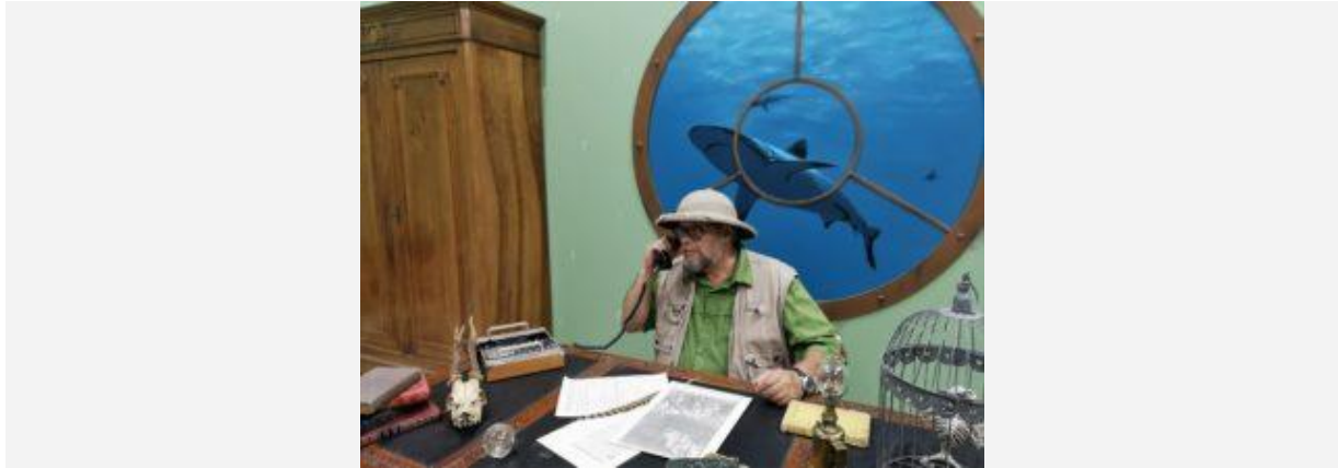
Le bureau des résolus, à Enigmaparc

Ce parc à thème, unique en Europe, proposera aux visiteurs un “accueil VIP” par petits groupes de 20 à 25 personnes, au cours duquel ils pourront découvrir l'histoire du site et ses coulisses à travers une rencontre avec le créateur et le décorateur du parc . A cette occasion, les Breilliens bénéficieront d'une réduction : 1 entrée adulte achetée, une entrée adulte à moitié prix (offre réservée aux particuliers -hors groupe- et sur réservation préalable au 02 99 47 07 65) .