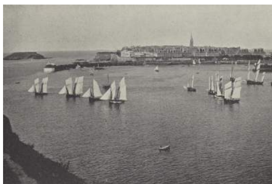
Régates de Saint-Malo vers 1900