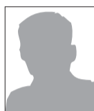
Isabelle BIARD Conseillère départementale