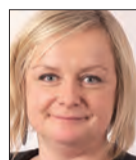
Frédérique MIRAMONT Conseillère départementale