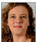
Béatrice DUGUÉPEROUX- HONORÉ Conseillère départementale